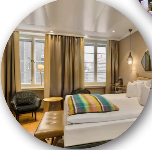
Hotell Solo Sokos