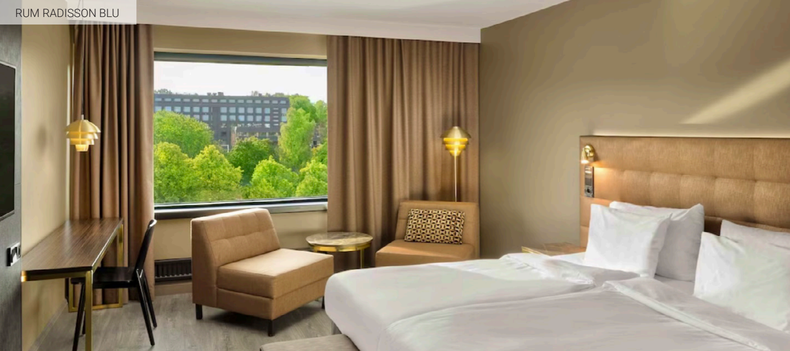
RUM RADISSON BLU