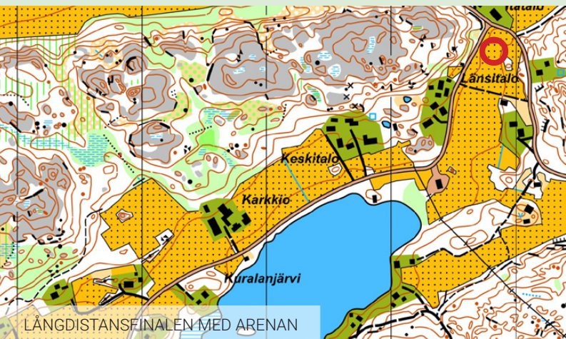
LÅNGDISTANSFINALEN MED ARENAN

Vi är mycket nöjda med våra olika resealternativ. Möjligheten finns att resa med båt, flyg eller att ansluta på egen hand. Vi kryssar med Östersjöns modernaste fartyg Viking Glory på utresan och med systerskeppet Viking Grace under återresan och båda har perfekta avgångs- och ankomsttider för vårt program. Våra direktflyg är med Finnair på mycket bra avgångstider från Stockholm, Göteborg, Köpenhamn och Oslo. För de som önskar finns även möjligheten att på egen hand ansluta till resegruppen i Åbo.