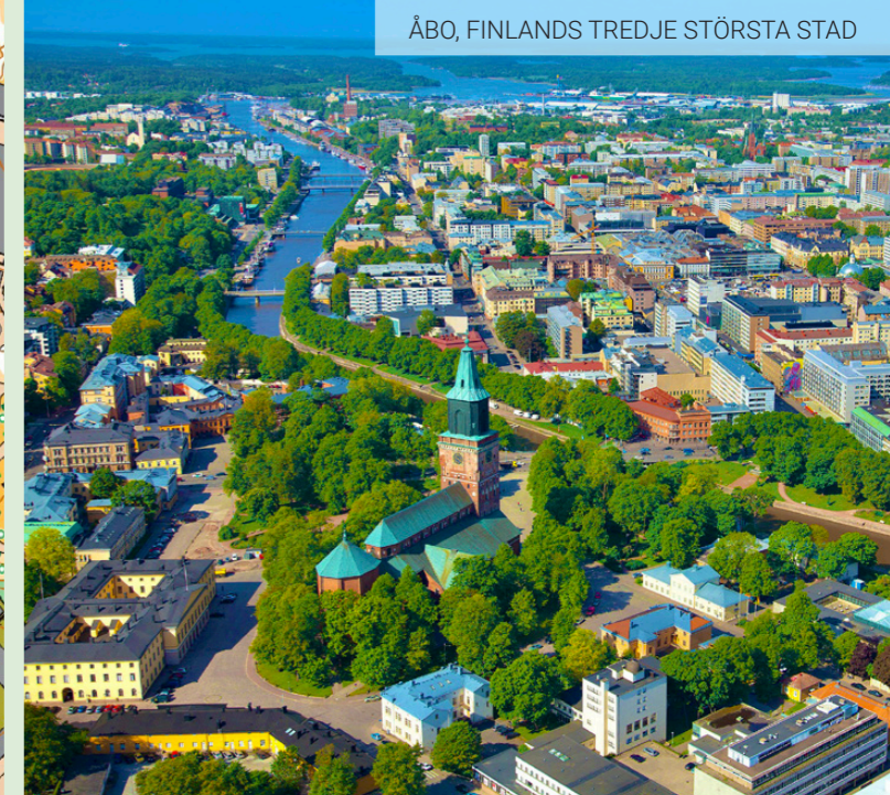
ÅBO, FINLANDS TREDJE STÖRSTA STAD