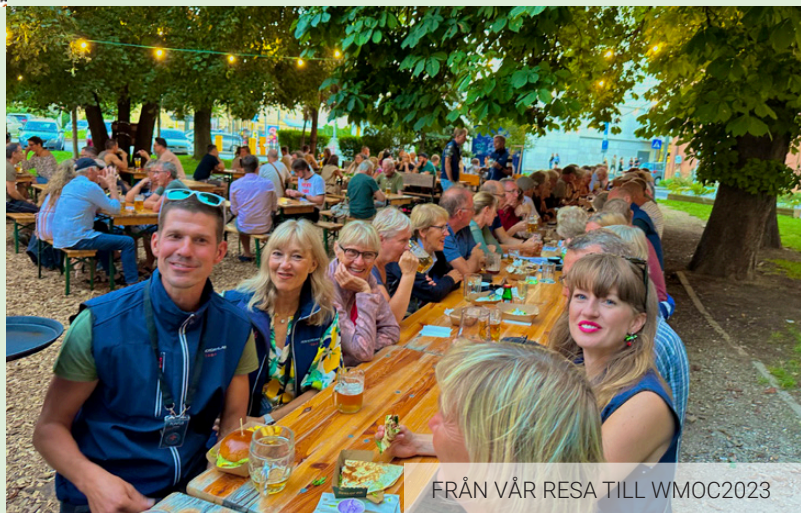
FRÅN VÅR RESA TILL WMOC2023

Välkommen med i gemenskapen på vår jubileumsresa!