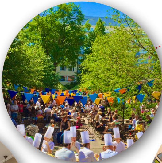
Social aktivitet Koulu