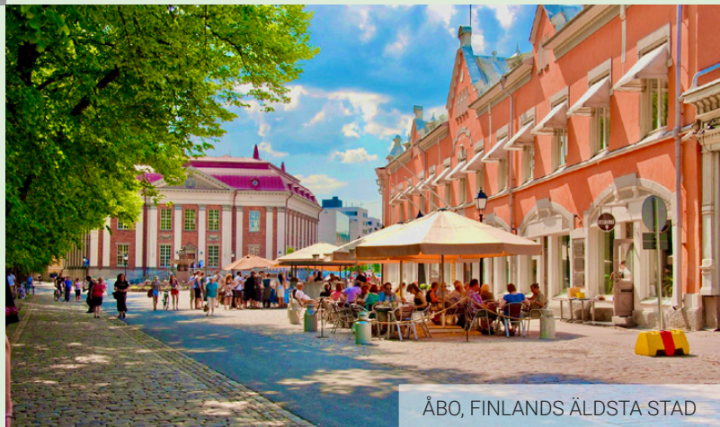
ÅBO, FINLANDS ÄLDSTA STAD

Vi är mycket nöjda med vårt program. Förutom att vi i Åbo har det mesta av det bästa samlat på en liten, koncentrerad yta intill våra hotell så är anrika Koulu inbokad för vår sociala aktivitet efter sprintfinalen och banketten efter medeldistansfinalen genomför vi i Åbos mest praktfulla festlokal. För att lära känna Finlands äldsta stad på bästa sätt så inkluderar vi guidade rundturer med svensktalande proffsguidar (och dansktalande för våra danska resenärer). Läs mer om detta och vårt övriga program på de kommande sidorna.