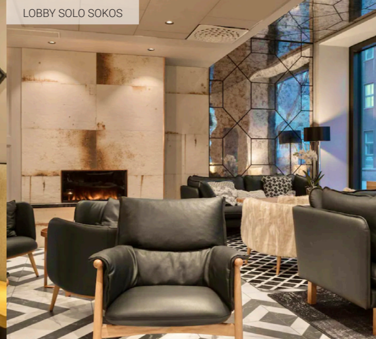
LOBBY SOLO SOKOS