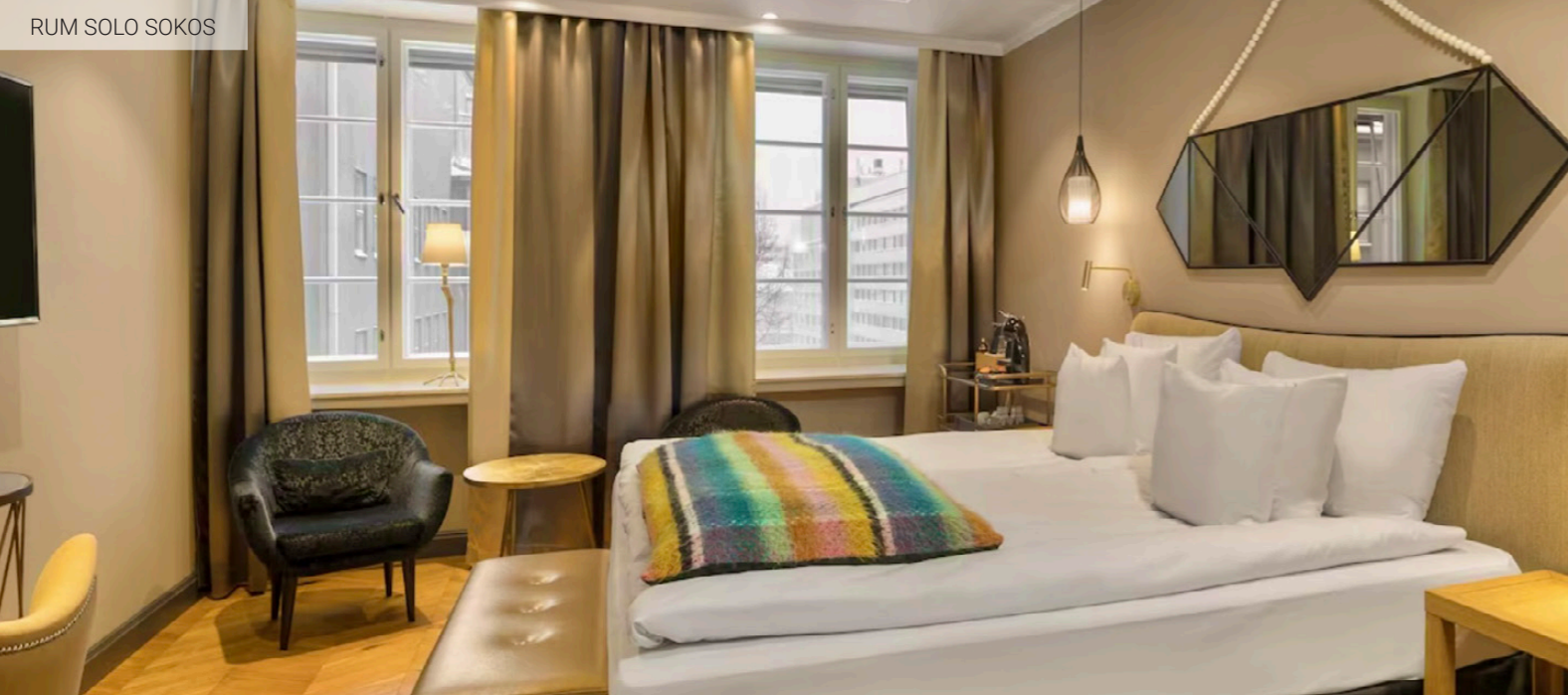
RUM SOLO SOKOS