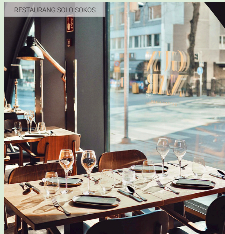
RESTAURANG SOLO SOKOS