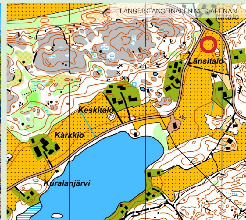
LÅNGDISTANSFINALEN MED ARENAN

Tävlingarna arrangeras med samma upplägg som tidigare,