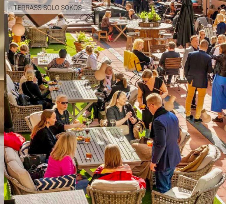
TERRASS SOLO SOKOS