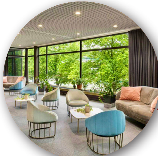
Hotell Radisson Blu