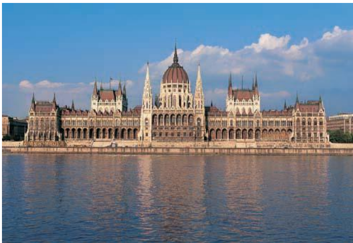
Parlamentet i Budapest med Donau i förgrunden

Vi har tidigare ordnat långresor till Budapest både för orienterare och studiegrupper och vi plockar nu ut det bästa ur dessa veckoprogram för vårt tilläggsalternativ, som kan väljas före eller efter tävlingarna. Under dagarna i Budapest genomför vi en guddad stadsrundtur med svensktalande proffsguide, ett speciellt kulturprogram med ungersk folklöreunderhållning och ungersk mat, en båttur på Donau från Budapest till Szentendre, bad på ett av Budapest berömda thermalbad, stadsvandringar, samt en träningsorientering. Boende i dubbelrum med frukost på bra hotell i centrala Budapest.