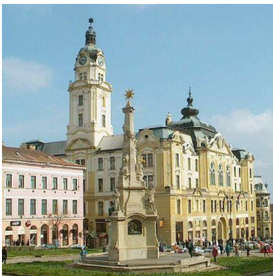
Stadshuset i Pécs

Våra egna aktiviteter omfattar också "det vanliga" med ett stort och variationsrikt program runt själva tävlandet. Den här gången bland annat med hästprogram och lunch på csárda, thermalbad, vinprovning från Villány-regionen, ett eget kulturprogram och vår egen bankett.