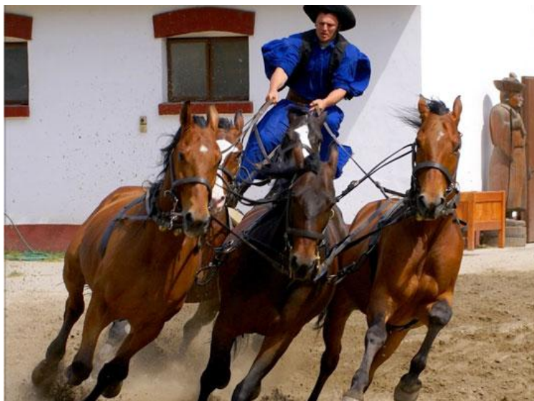
Hästprogram och lunch på csárda

Bussalternativet inkluderar logi i 2-bäddshytt under ut- och hemresan samt i båda riktningarna ytterligare en övernattnings i 2-bäddsrum. Den totala körsträckan från Rostock till Pécs är endast 130 mil, som då under utresan delas i 3 etapper (med stopp i Budapest) och under hemresan klaras av under 2 resdagar. Vi passerar inom eller i utkanten av 5 starka europeiska huvudstäder, Berlin, Prag, Wien, Bratislava och Budapest, samt bland städer av dignitet så åker vi även genom Rostock, Dresden och Brno.