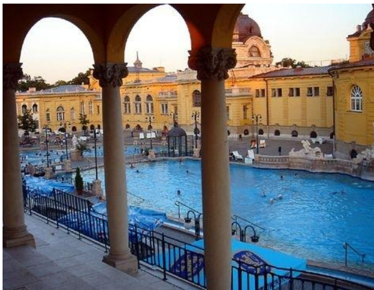
Thermalbad – i Budapest och under tävlingsdagarna