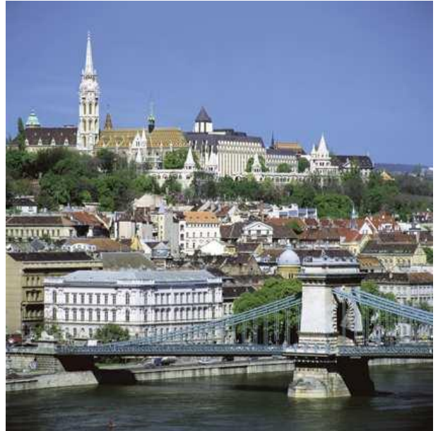
Kungliga slottet på Budasidan av Donau